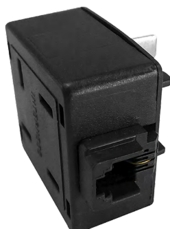
Adaptador pino Jack/Jack