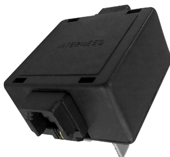
Modular Jack Duplo