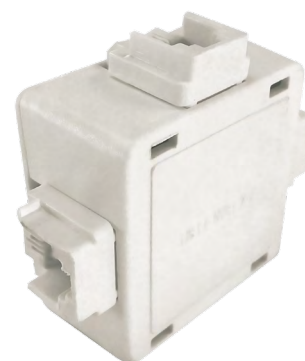
Adaptador pino 3 Jack ´s