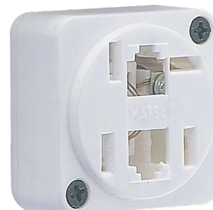
Fêmea Padrão 2 Jack ´s