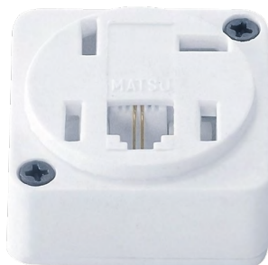
Fêmea Padrão 1 Jack